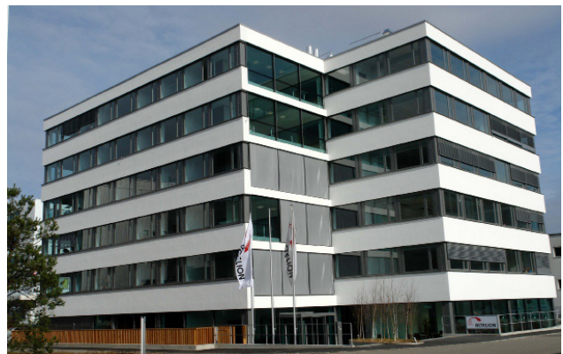
Zentrum für klinische Entwicklung