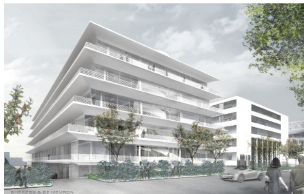
Forschung & klinische Entwicklung 2 – im Bau

Im Februar 2009 begannen die Bauarbeiten für ein, ebenfalls von Herzog & de Meuron entworfenes, neues Zentrum für Forschung und klinische Entwicklung. Es soll dem wachsenden Bedarf an Labors und Büroraum Rechnung tragen und Platz für etwa 380 Mitarbeitende bieten. Das Gebäude soll 2012 fertiggestellt werden.